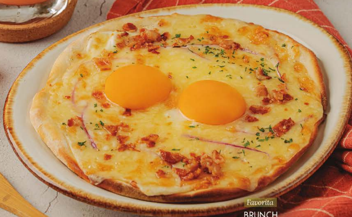
Favorita BRUNCH FLATBREAD