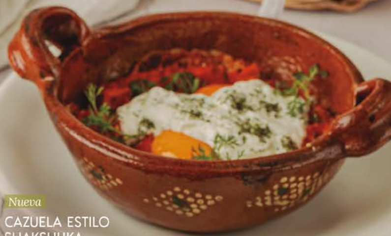
Nueva CAZUELA ESTILO SHAKSHUKA