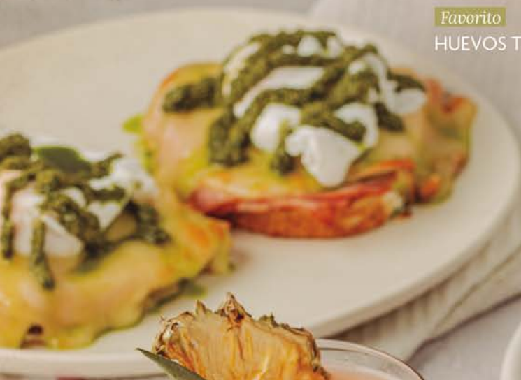
Favorito HUEVOS TOSCANA